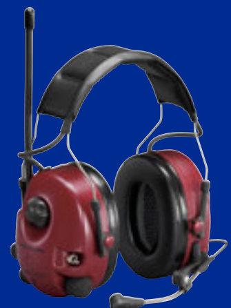
Alert Flex Headset