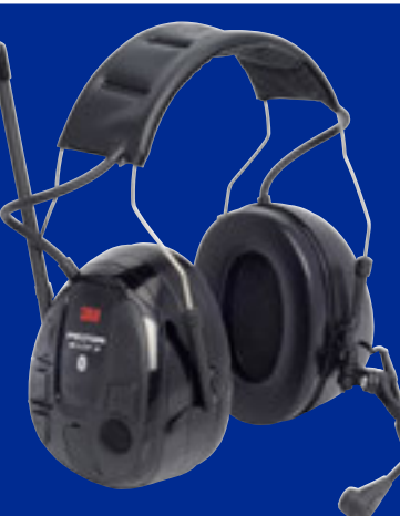
WS Alert XP