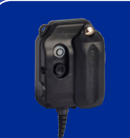
WS Adapter Flex