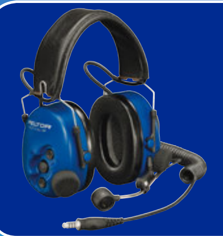
ATEX Tactical Headsets