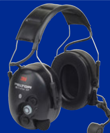
WS ProTac XP Flex