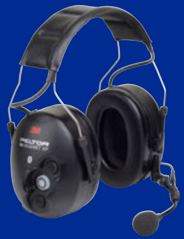
WS Headset XP