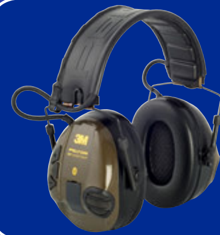
WS SportTac Light