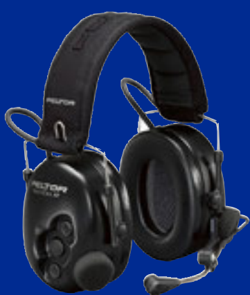
Tactical XP Flex Headset