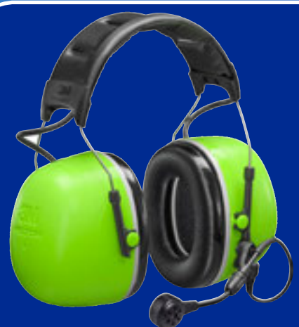
CH-5 Flex Headsets