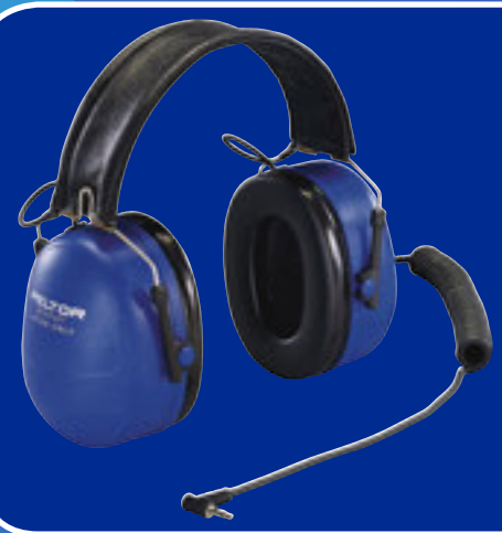
ATEX Listen Only