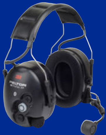
WS ProTac XP