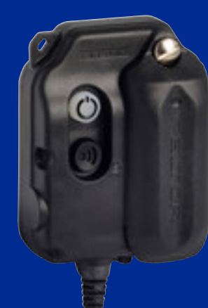
WS Adapter Flex