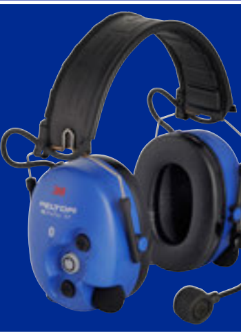
WS ProTac XP ATEX