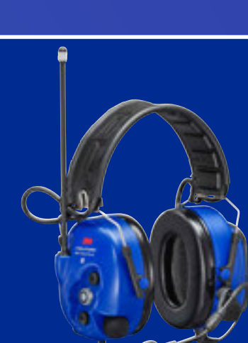
WS LiteCom Pro III ATEX