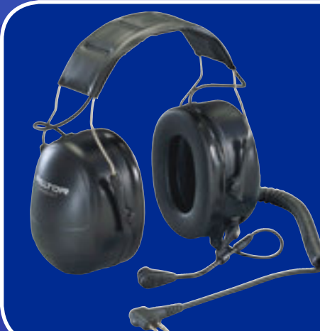
Direct Lead Headset